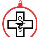
Pharmacie des Charmes