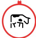
Besseas et fils