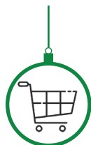
Val Presse Genay La vie claire